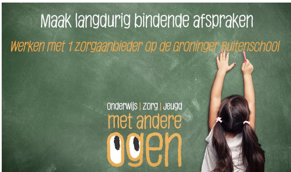
'Still' inspiratiefilmpje Groninger Buitenschool 'Werken met 1 zorgaanbieder'

Vervolgens is door Met Andere Ogen, op basis van één van de adviezen, een inspiratiefilmpje gemaakt op de Groninger Buitenschool. Dat is te vinden via: https://vimeo.com/628904375