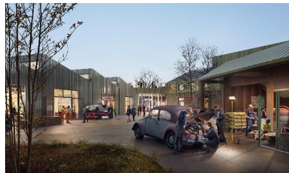
Impressie onderwijscampus Appingedam, beeld De Unie architecten

Om alle betrokkenen, scholen en schoolbestuurders goed te kunnen blijven informeren over de voortgang, brengt de kerngroep met enige regelmaat, ongeveer iedere zes tot acht weken, dit bulletin uit, waarin gerapporteerd wordt over de stand van zaken van het traject toekomstagenda. In het bulletin zult u ook meer kunnen lezen over het inventariserend onderzoek, de visieontwikkeling en de bouwstenen. Daarnaast wordt er in het bulletin aandacht besteed aan goede voorbeelden die er in de dagelijkse praktijk van de scholen al zijn, op het gebied van toekomstbestendigheid en samenwerking, inclusiever onderwijs en kansengelijkheid. Als u die wilt aandragen, neemt u dan contact op met Ciska Renken , die de kerngroep ondersteunt, of Tsjerk Bottema , die de redactie van de nieuwsbrief verzorgt.