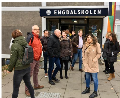
Een deel van het reisgezelschap voor de Engdalskolen, gemeente Aarhus

In de middag bezoeken we Engdalskolen in Aarhus. De school bemerkt dat het schoolverzuim toeneemt, o.a. door de ervaren hoge druk op prestaties. Veel leerlingen kennen angstproblematiek. Een tendens die we in Nederland ook zien. We ontvangen hier informatie over een nieuwe wet inzake verzuim, waarbij ouders gekort kunnen worden op een soort kinderbijslag als de leerling niet naar school gaat.