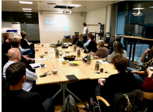
Presentatie gemeentehuis Aarhus

Aan het einde van maandag 4 november zijn we per bus naar Aarhus gereisd. Aarhus is een relatief grote plaats met 350.000 inwoners, het is de 2 de grootste stad in Denemarken. Op 5 november hebben we in de ochtend een bezoek gebracht aan de gemeente. Ook hier hebben we presentaties gehad over het werk van de gemeente Aarhus in relatie tot onderwijs en jeugdhulp. Zowel in Aarhus als in Herning ligt veel nadruk op leren en op welbevinden als basis. Waarbij het vooral belangrijk is dat leerlingen vooruitgang boeken: 'niet iedereen hoeft hersenchirurg te worden.'