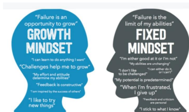
Fixed mind set versus Growth mind set van Carol Dweck

Ook hier zien we veel aandacht voor de inclusieve praktijk. Op Herningsholm wordt gebruik gemaakt van het concept van Carol Dweck en de ‘growth mind set’ (incrementele theorie van intelligentie, groei) versus de ‘fixed mind set’ (gefixeerde theorie van intelligentie, gebaseerd op aangeboren vermogens). Ook wordt er veel gewerkt met Positive Behavior Support (PBS)-achtige settingen.