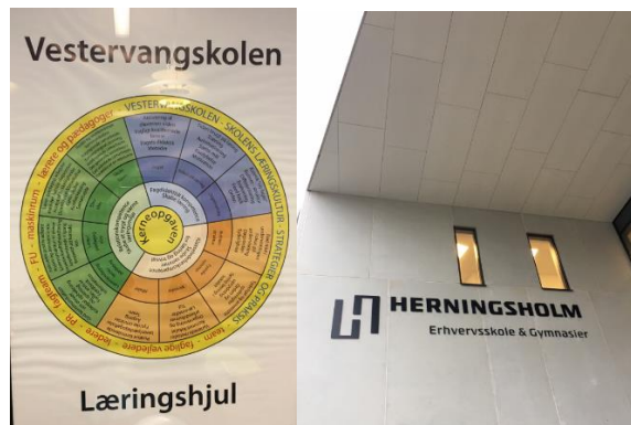
Vestervangsskolen en Herningsholm, gemeente Herning

In de middag hebben we twee schoolbezoeken afgelegd: aan de Vestervangsskolen (Folkeskole 6-16 jaar) en aan Herningsholm Vocational school and upper secondary schools (15-17 jaar).