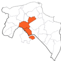
Regio Samenwerkingsverband VO 20.01 Stad Groningen

Daarnaast geeft het 'Steunpunt Passend Onderwijs' informatie aan ouders van leerlingen met een extra ondersteuningsbehoefte. Het Steunpunt is een samenwerking tussen oudervereniging Balans en leder(in) en is onderdeel van 5010, het informatiepunt voor ouders over onderwijs. Te bereiken via: www.steunpuntpassendonderwijs.nl , telefoon: 0800-5010.